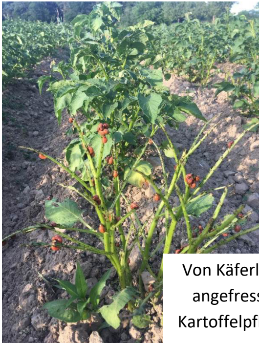
Von Käferlarven angefressene Kartoffelpflanzen

Kartoffelkäfersammeln , ihr könnt jederzeit Käfer auf dem Kartoffelacker sammeln, das verhindert eine erneute Eiablage und sorgt für weniger überwinterte Käfer. Am Feld steht ein Schild welches markiert bis wohin schon gesammelt worden ist, das könnt ihr bitte versetzen, wenn ihr eine Reihe gesammelt habt.