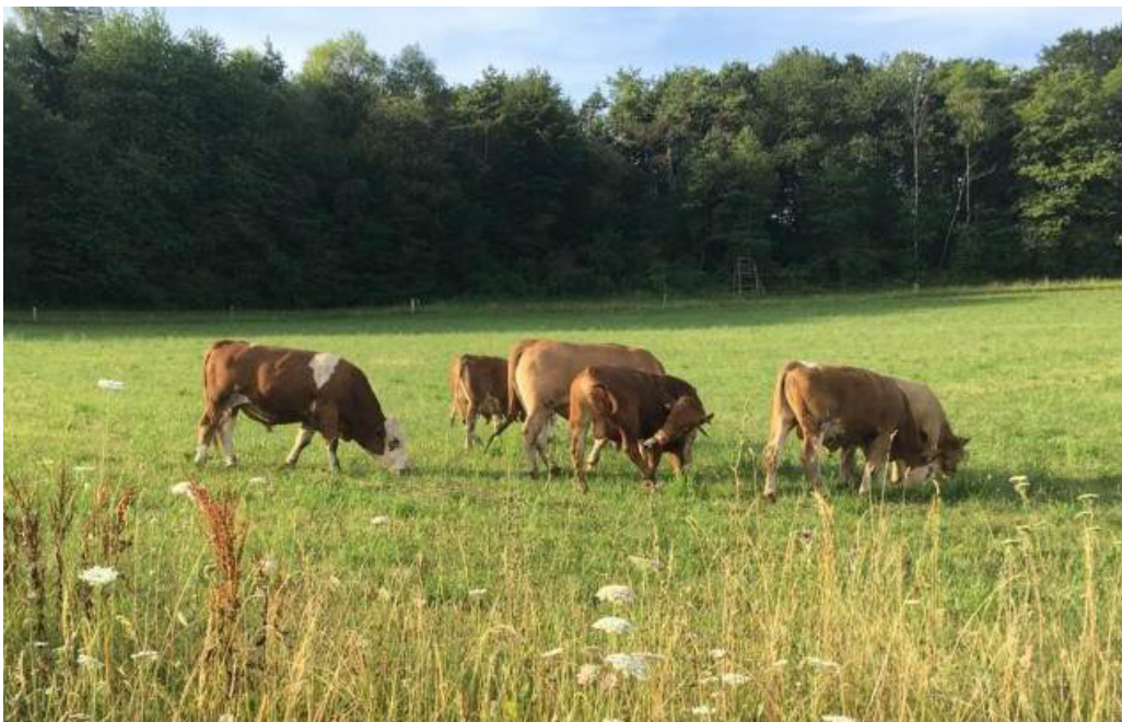
Die Bullen sind nun endlich auf ihrer Weide (von oben kommend links) und genießen frisches Gras, Sonne und Bewegung.