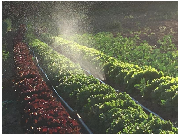
Fotos v.l.: Möhren nach dem Jäten vom Beikraut befreit, Salate während der Bewässerung