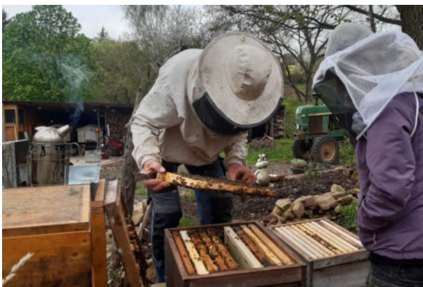
Auch die Bienen müssen im Frühjahr regelmäßig kontrolliert werden, wenn man das Schwärmen verhindern möchte.