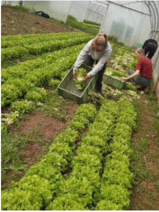
Die wöchentliche Ernte in den Gewächshäusern.