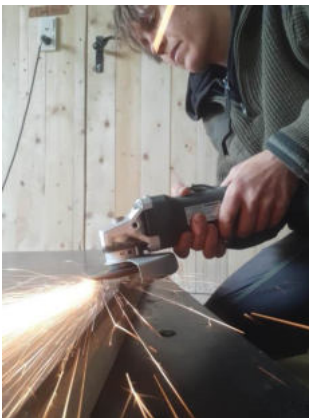
Für die neuen Bruderhähne, die am 10. Mai zu uns kommen sollen, haben wir eine Futterkiste gebaut.