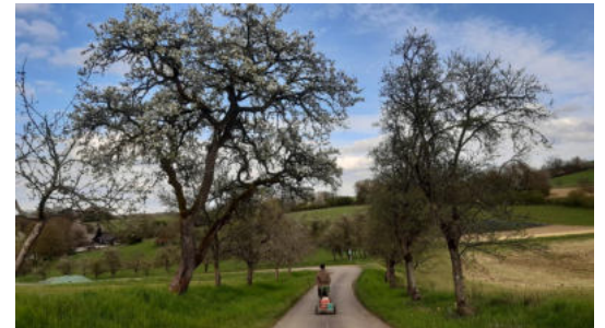
Das tägliche Eiersammeln mit dem ,Milchwägelchen‘