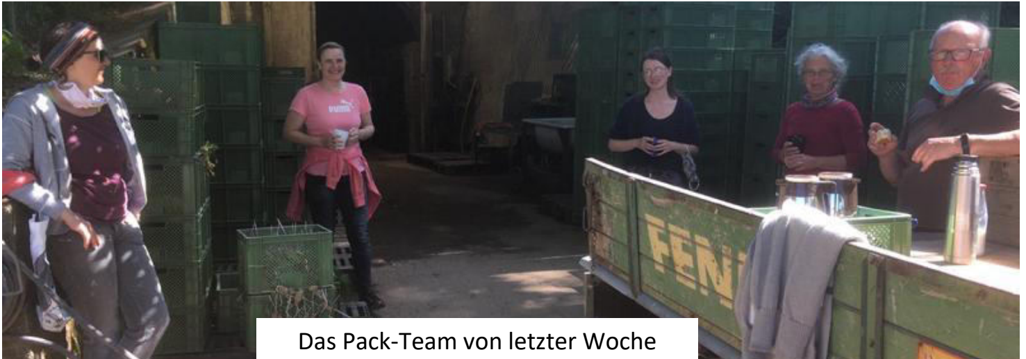
Das Pack-Team von letzter Woche