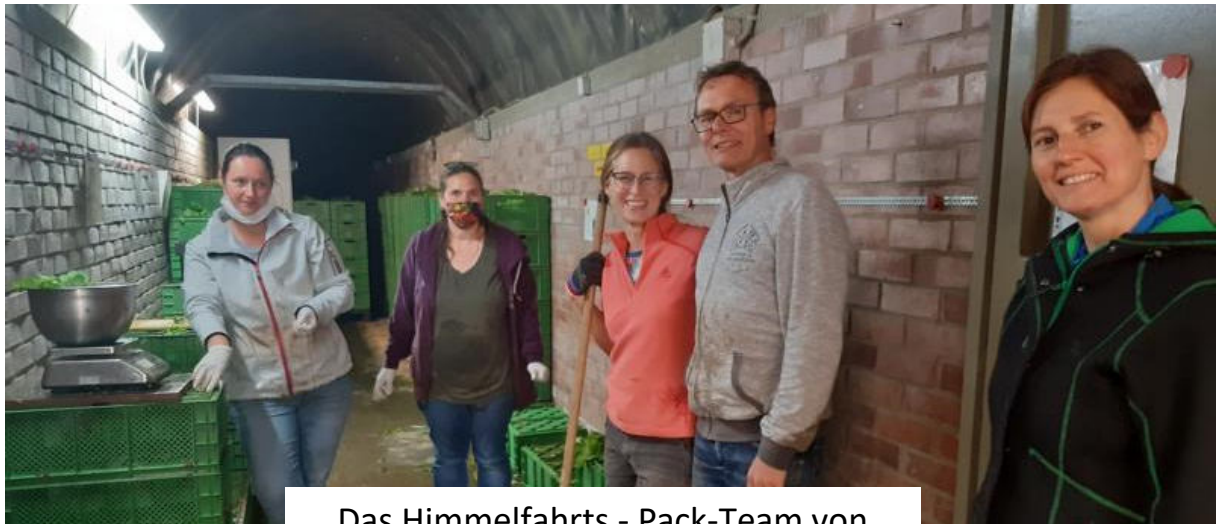
Das Himmelfahrts - Pack-Team von letzter Woche

Beim letzten Mit-MACH-Freitag waren 2 Helferinnen mit Kindern zum Hacken mit uns auf dem Acker.